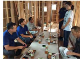
お客様からは感謝の言葉を頂戴しました