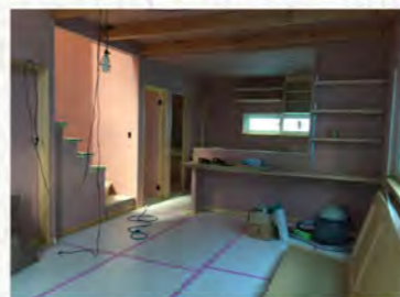
このピンクのボードがハイクリンボード。実際の工事現場での施工の様子です。