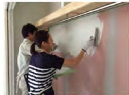
はじめからスイスイととても上手でしたー!