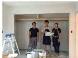
先生! 今日はありがとうございましたー!