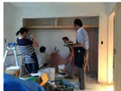
ここはクローゼットの奥の壁です。