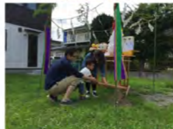
とっても上手に出来ました(#^_^#)