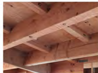
上棟前にO様にエイジングしてもらった梁