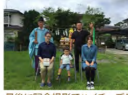
最後に記念撮影でハイチーズ!