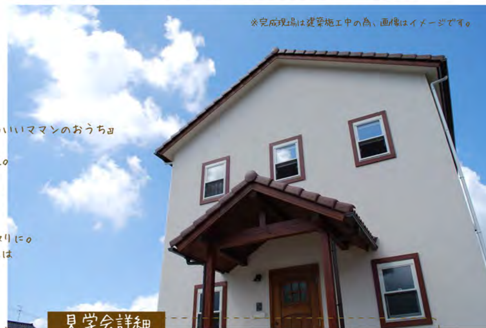
※完成現場は建築施工中の為、画像はイメージです。

お客様のご厚意で 完成見学会を開催する事になりました。 是非この機会にご覧頂きたいと思っております。