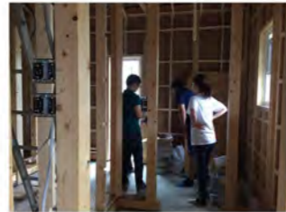
玄関脇の土間部分