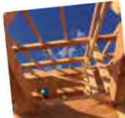
晴れ間が気持ちいい!!