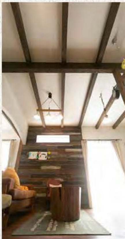
天井の仕上がり例 (リビング)

今後も少しずつ1階、2階の遮音制限には取り組んでいきます。仮説と検証による方向性が立証できた時さらなる遮音制限ができればと思います。これからも小さなこだわりを積み重ねていきます。