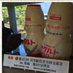
誰もが知っているヤクルト