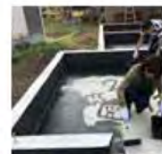
これから塗りつぶします(汗) 真っ黒になってきました！