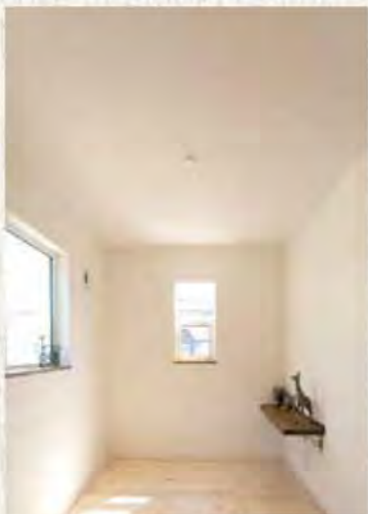
天井の仕上がり例 (寝室)

石膏ボードも通常9mmが主流ですが、こちらも少しでも遮音制限に役立てばと思い12.5mmを採用しています。2階との部材合計は136.5mmになります!!