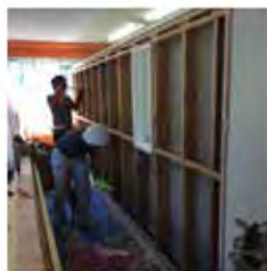
解体していきます。

解体していきます。 先生や保護者の方々からは評判が良いとの事です。これからの国際化には是非授業レベルの高い英会話教室。上杉、泉にあるノーベル学院へGo!!^^ ノーベル学院さんHPはこちら→ http://www.77nobel.jp/