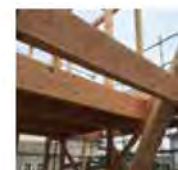
エイジングの梁がガッチリ組まれて^^