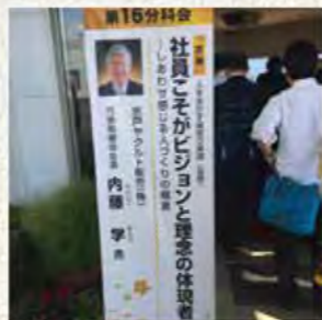
売れ続けている秘密がありました。