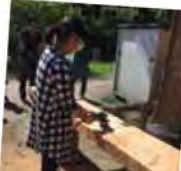
お姉ちゃんも慎重に丁寧に