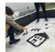
可愛いママンのおうちです。