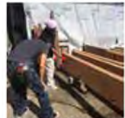
エイジングの前に説明を受けています。

W様邸では、秋晴れの気持ちの良い日に梁のエイジング作業を行いました(^^) まずはお父さん、そしてお母さん、お姉ちゃん、小さなお兄ちゃんと、皆さんとも器用に工具を操ってちょっとした職人レベルでした☆動かすのも一苦労のとても大きくて重い梁。ちくちく刺さった木くず。工具に負けないようしっかりと握りしめた手の感触。リビングの天井を見るとこの日の思い出がしっかりとよみがえって来ると思います(^-)-☆W様ご家族お疲れ様でした。