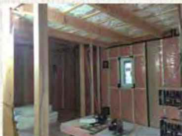
天井 (断熱材施工中)

2階床と1階天井の間には80mmの断熱材を入れています。断熱材の効果より2階床の音を少しでも制限する為です。