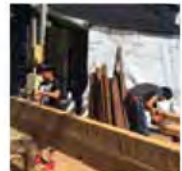
お父さんの後ろではお兄ちゃんが！