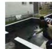
完成です！お疲れ様でした。