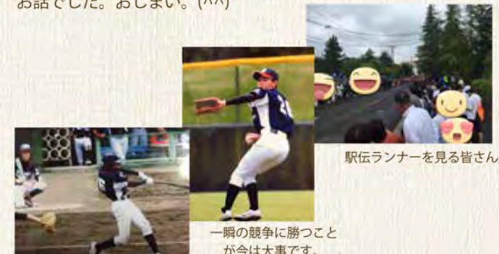
チーム内では打率、打点、盗塁成功率などの競争があります。

のかもしれない。こう考えると競争という名の行動全てにエキサイトする事が日常化しています。 同じ発音の共奏は「共に奏でる」共奏です。 現役時代には十二分に「競争」に向かっていく事で強くなり人と人の関わり方を学んでいくので私はとても良い事だと思っています。 一方でオフタイムや引退後などは競争で培った人間力を生かし、共に奏でる「共奏」へと向かっていって欲しいです。 チームワークや協力する事の大事さ、人が一人で出来る事は誰かの役に立つ事ではなくあくまでも自分の身の回りの事だけです。 同じ発音の「きょうそう」を時には「共奏」と思うだけでぱっと明るくなる気がします。 まだまだ競争真っ只中の次男へ伝えたい「共奏」のお話でした。おしまい。(^^)