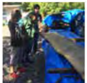
カウンターを選定中(^^)♪