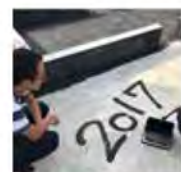
記念に今日の日付を！

Y様邸では基礎部分への墨塗り防蟻工事に来て頂きました。エコパウダーという塗料を塗っていく単純な作業ですが、中腰で見た目以上に変なのです！ まずはお楽しみのお絵かき。奥様がかわいいママンのお家のイラストも描いてくれましたよ(^^) 洋風の中にも畳だったり建具だったり和の部分も取り入れたいとお二人。ご夫婦のイメージに少しでも近づけていきます。