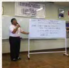
茨城青年部会の皆様 ありがとうございました。