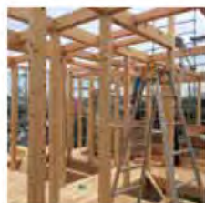
大貫建築の代名詞、檜柱がこれでもかと建っています。法隆寺も柱は檜です。