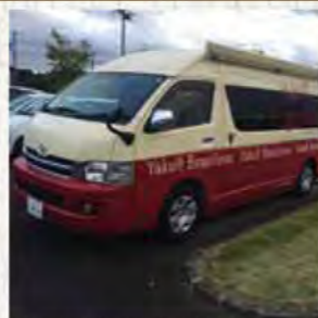
ヤクルト色のワゴン車です。

9月14日、15日茨城県へ 経営者が全国から1300名集いより良い経営者になる為。 良い経営環境づくりをする為。 良い会社を創る為。 真剣に二日間共に学びました。 分科会ではヤクルト販売日本一を5年連続で達成している。 水戸ヤクルトさんを選びました。 ヤクルトの歴史。 水戸ヤクルトさんの理念と実践。 様々な取り組みを聞き、日本一になるだけの理由が なるほど沢山詰まった二日間でした。 学びを得て、自社の経営に生かしていきます!! 茨城青年部会の皆さん、設営、準備 本当にありがとうございました。m(_ _)m