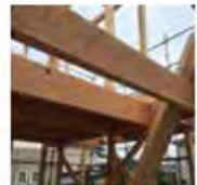
棟された梁にはしっかりエイジングの跡が(^^)